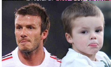
Peter Andre και ο γιος του Junior