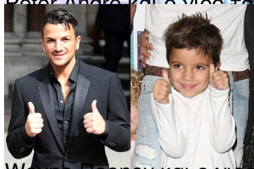
Wayne Rooney και ο γιος του Kai